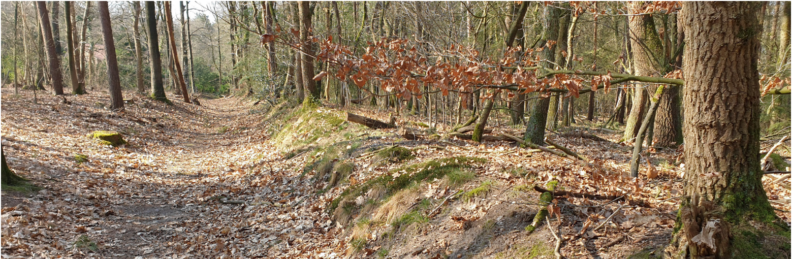
De wildwal ter hoogte van de Beukenlaan/Engweg bij Lunteren

Aarden wallen maken al eeuwen deel uit van het Veluwe landschap. Eén van die wallen springt vooral in het oog: de wildwal die van Meulunteren tot Wageningen loopt via Lunteren, Ede en Bennekom. Met een lengte van bijna 22 km is dit de langste wildwal van Nederland. Deze folder vertelt u meer over dit bijzondere cultuurhistorische fenomeen.