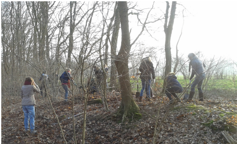
Onderhoudsdag op de wildwal

Ook tegenwoordig lopen de resterende delen van de wildwal het risico beschadigd te worden. En een enkele maal gebeurt dat ook, vooral als gevolg van onbekendheid met het bestaan en de oorspronkelijke functie van de wildwal. In die situatie proberen verschillende partijen verandering te brengen door grondeigenaren, buurtbewoners en bezoekers te informeren over de wildwal en te enthousiasmeren voor het behoud van dit cultuurlandschappelijke object.