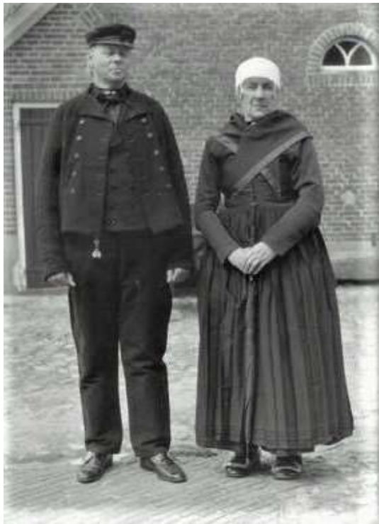
Zware rouw streekdracht Veluwe

de klok werd stilgezet en de spiegel met een wit laken afgedekt. Foto's, voor zover aanwezig, werden verwijderd. De naaste familieleden van de overledene waren druk doende de rouwkleding in orde te brengen. Gelukkig waren de zondagse kleren van de meeste mensen toch al zwart, dus voor hen was er niet direct een probleem. Maar anderen, met meer wereldse opvattingen, moesten - als nieuw kopen niet kon lijden - in allerlei diverse kledingstukken zwart worden geverfd. Rouw dragen was een oeroude plicht waaraan streng de hand werd gehouden. Slechts een enkeling die zich aan de gebruiken durfde onttrekken.