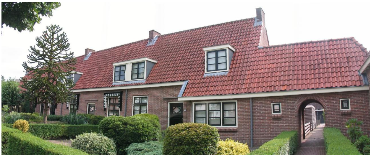
Afb. 4. Foto genomen nabij de aanduiding 2 op de situatietekening: voorbeeld van verspringingen in rooilijn en hoogte.