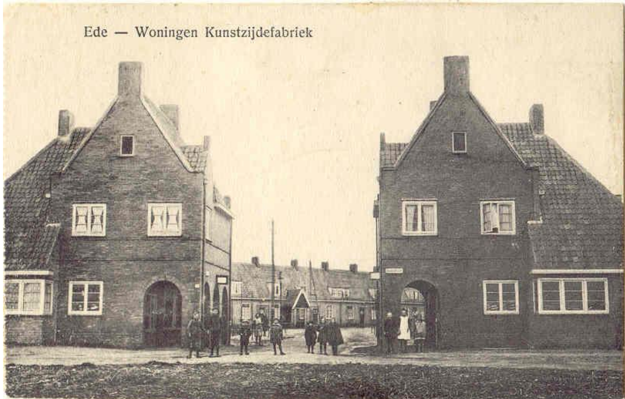
Afb. 1. Ede, Poortplein, Woningen Kunstzijdefabriek , Van der Burgh en Eschauzier.

Dankzij de spontane medewerking van de bewonerscommissie van Tuindorp Vooruit krijgt u deze Open Monumenten Dag een andere kijk op het gemeentelijk monument.