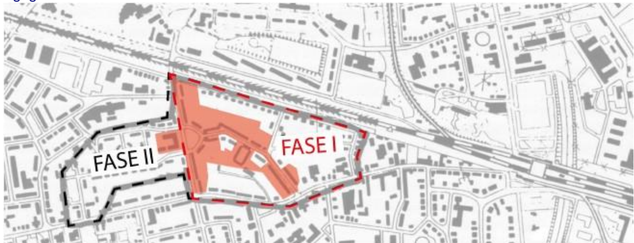
Afb. 2. Faseringsplattegrond. Rood omlijnd: fase I; zwart omlijnd: fase II; rood gearceerd: gemeentelijk monument (onderlegger: Kooiman, "Een tuindorp in Ede," 17; bewerking: auteur).

Graafhoek, Kortelaantje, Poortplein (westzijde) en de Kerkweg (westzijde). De tweede fase van het tuindorp is in de periode 1995 tot 2003 vervangen voor nieuwbouw, omdat dit deel van mindere kwaliteit was. Een deel van de eerste fase van het tuindorp is in 1997 aangewezen als gemeentelijk monument (afb. 2). In de onderstaande tekst zal op dit monumentale deel worden ingegaan.