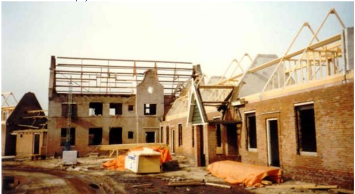
Afb. 6. Ede, Poortlaan, Stadsvernieuwing.

Dat het tuindorp niet geheel is gesloopt is mede te danken aan de buurtbewoners, die zich fel verzetten tegen de al aangekondigde sloop van de wijk. Zowel de protesten als de renovatie hebben indruk achtergelaten bij de bewoners. Enkele van hen markeerden hun voordeur met 'deze woning wordt niet gesloopt'. Uiteindelijk besloten de gemeente Ede en Woonstede dit gedeelte van het tuindorp te sparen. Tijdens de renovatie kregen de bewoners een wisselwoning. Voor sommigen was dit zo ingrijpend dat zij niet meer terugkeerden. De voltooiing van de renovatie van het tuindorp kreeg ruime belangstelling; SBS 6, RTL, de Publieke Omroep en Omroep Gelderland maakten reportages. In 1999 ontving het project de Nationale Renovatieprijs.