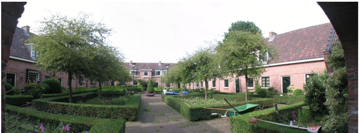
Hofje aan de Poortlaan.

De bewonerscommissie van Tuindorp Vooruit, dat in de jaren twintig van de vorige eeuw gebouwd is, wil graag hun buurt in het zonnetje zetten en organiseert samen met de Vereniging Oud Ede om 10, 11, 13 en 14 uur een wandeling door de buurt waarbij verteld wordt over het unieke karakter van het Tuindorp. De wandeling start op het Poortplein.