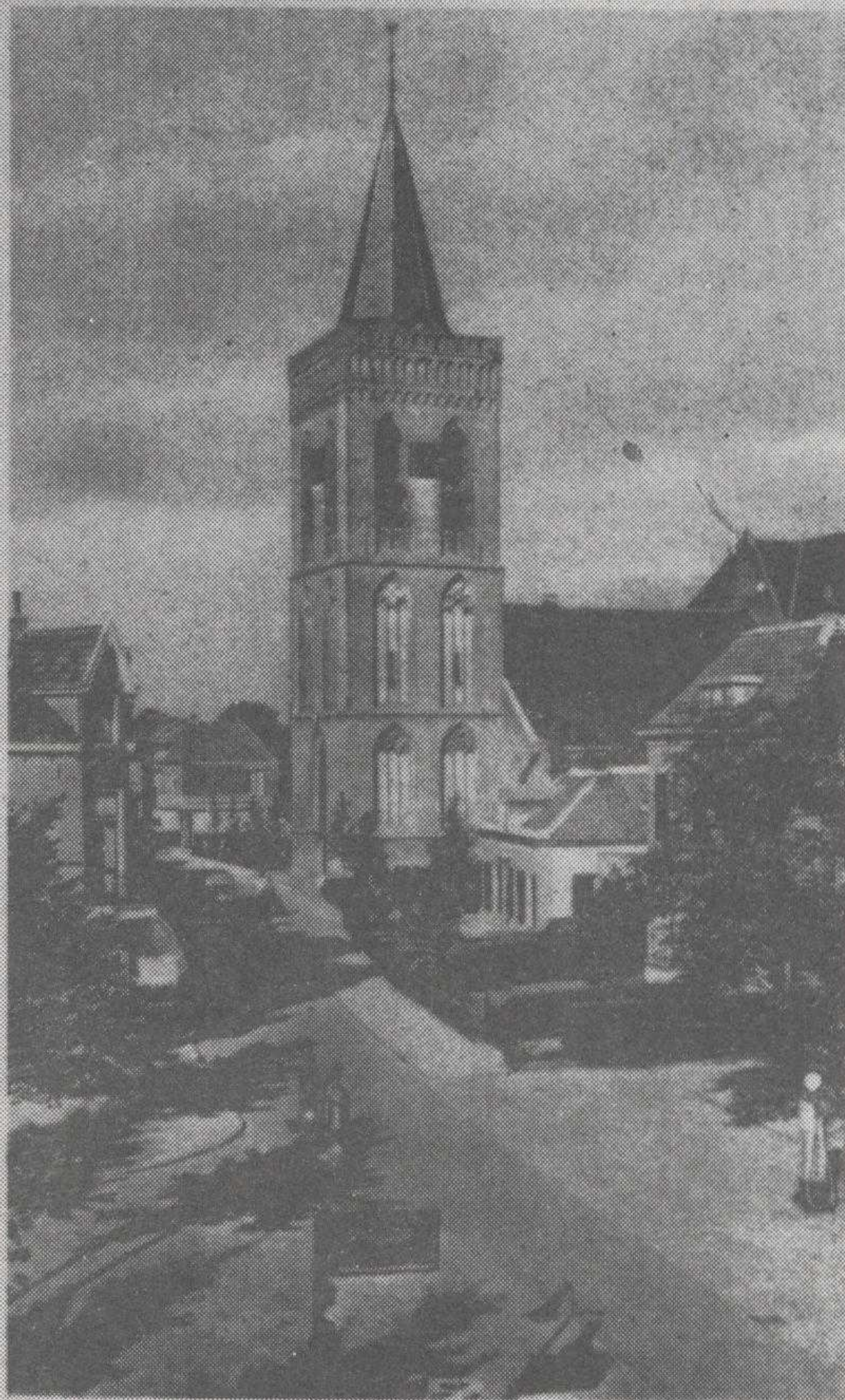
Ede - N. Hero. Kerk