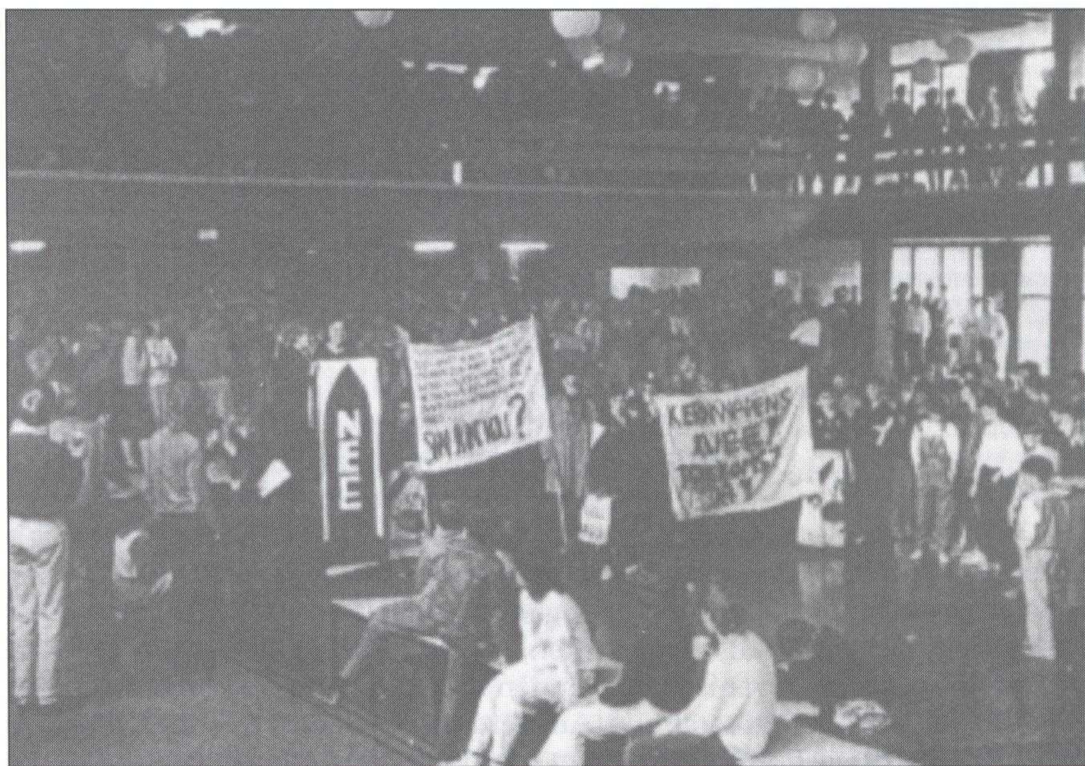
Demonstratie tegen kernwapens.

Een docent die in zijn lessen maatschappijkritische opmerkingen maakte, kreeg geen vaste aanstelling en een leerling die verklaarde "met de bijbel dicht te leven", werd niet representatief genoeg geacht om voorzitter van de leerlingenraad te worden (96) . Maar al in 1978 kwam de Commissie Doelstellingen tot de conclusie dat er binnen de school een grote verscheidenheid van meningen bestond over wat christen-zijn eigenlijk is en dat dit tot sterke polarisatie kan leiden (97) . Zeker wanneer politieke zaken in het geding waren.