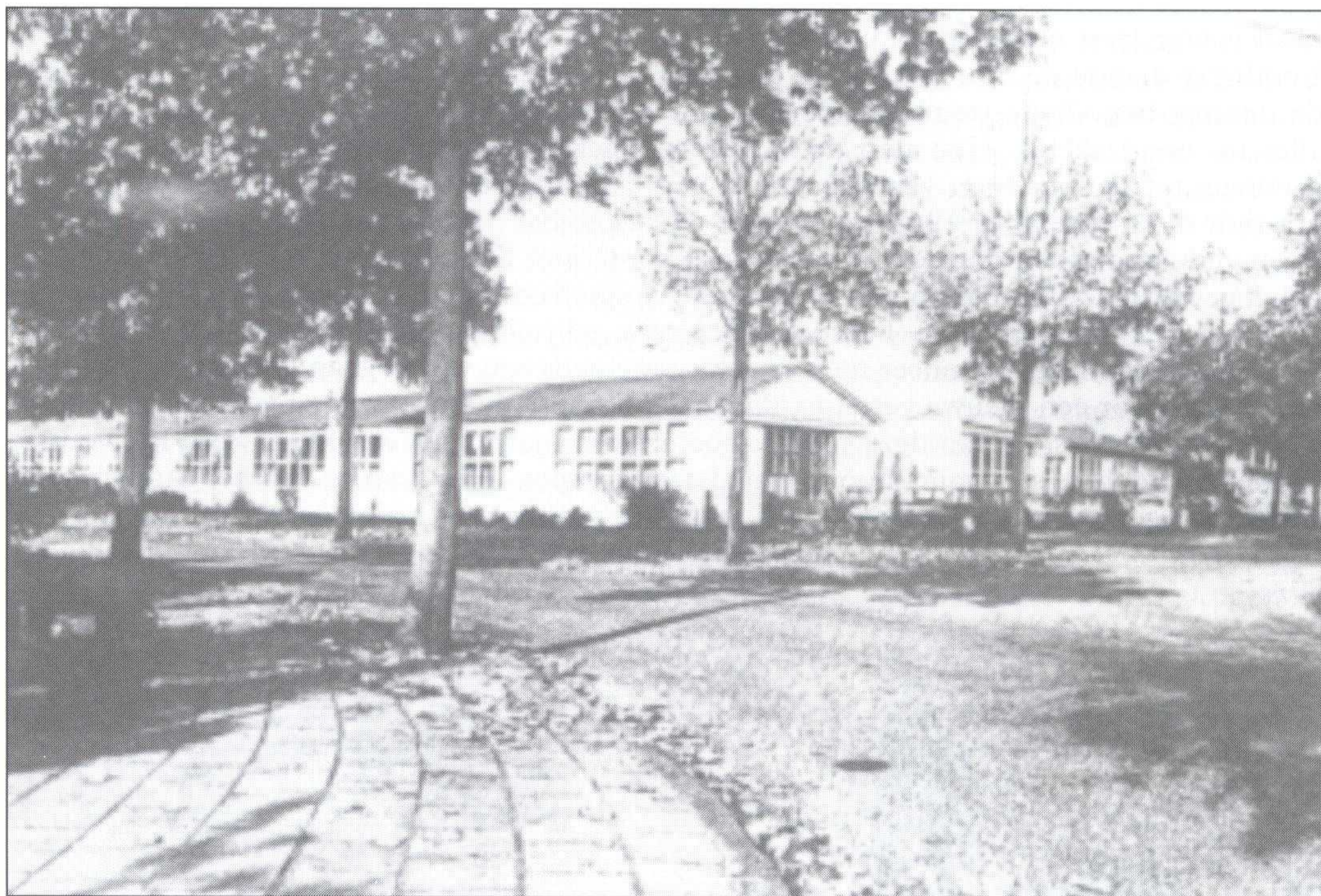
De houten barakken aan de Irenelaan waar het Streeklyceum in 1961 zijn intrek nam (Foto: Gemeentearchief Ede, nr. 6699).

beroemen, dat zij het toch al behoorlijk ver gebracht hebben". Naar aanleiding van de geschiedenis van Gideon, die hij tevoren had voorgelezen, betoogde hij "dat alle mensenwerk slechts in Gods kracht volbracht kan worden en dat het altijd tot eer van Hem moet geschieden" (66) .