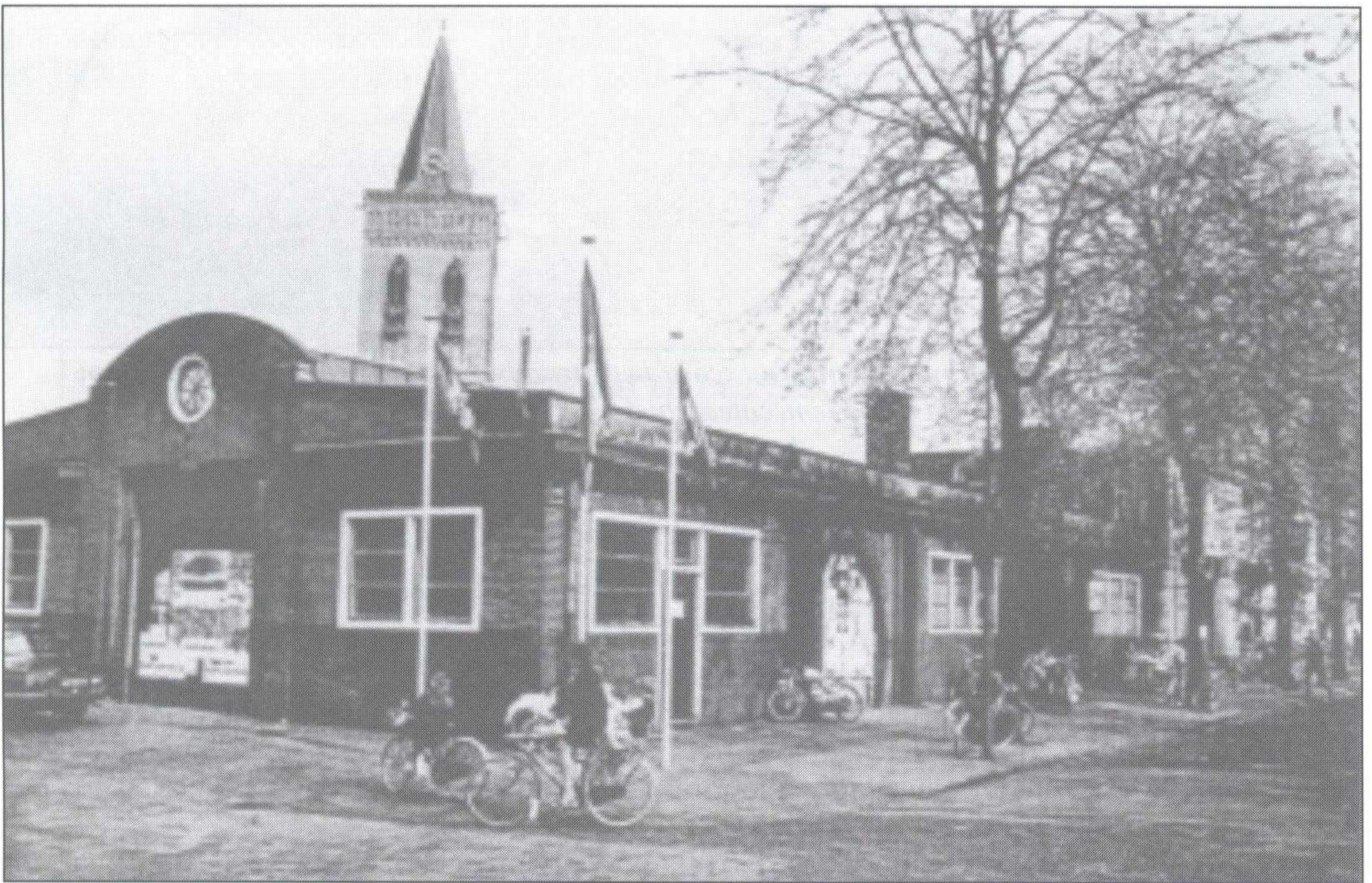
Het oude Marktgebouw in Ede-centrum dat in de beginperiode enige tijd als dependance werd gebruikt.