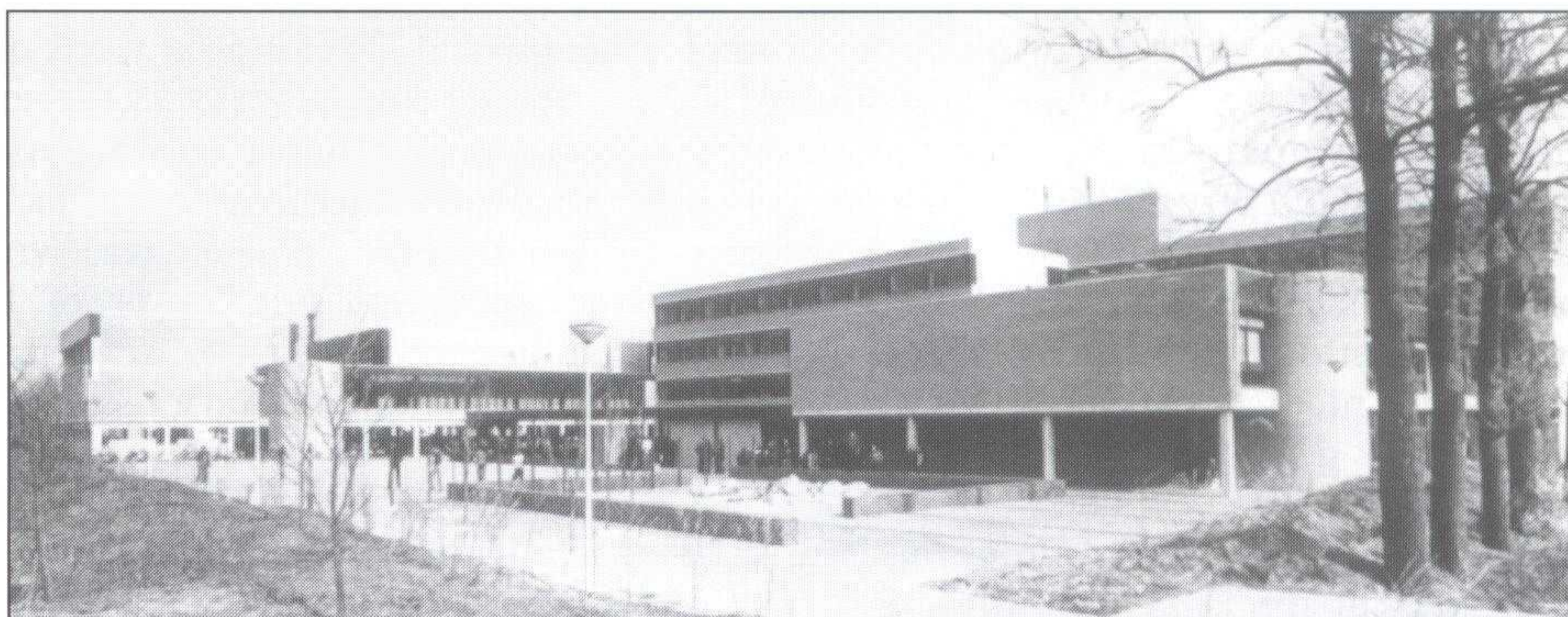
De fraaie nieuwbouw aan de Bovenbuurtweg werd in 1976 in gebruik genomen

Door de hierboven geschetste ontwikkelingen werden de prognoses betreffende de te verwachten leerlingenaantallen voortdurend achterhaald en moest het bestuur van het Streeklyceum bijna jaarlijks op zoek naar nieuwe lokalen. In 1971 werd de dependance 'Zuid' in gebruik genomen. Deze werd gehuisvest in de afgeschreven gebouwen van Victoria Vesta aan de Tooroplaan. Een jaar later betrok men aan de Mauvestraat een tweede dependance. Op 12 juli 1974 verkreeg het bestuur een bouwvergunning voor een school met 44 lokalen, drie gymnastieklokalen en een portierswoning aan de Bovenbuurtweg (84) . Twee jaar later werd afscheid genomen van de houten barakken en kon op 31 maart de (stenen) nieuwbouw aan de Bovenbuurtweg in gebruik worden genomen: na vijftien jaar deed het Streeklyceum zijn "intrede in het stenen tijdperk" (85) . Helaas was het gebouw bij de opening al te klein: slechts 1050 leerlingen vonden er onderdak; de rest kreeg les in enkele noodlokalen naast de nieuwbouw. In 1985, toen de school vijfentwintig jaar bestond, was het totaal aantal leerlingen tot 1550 en het aantal docenten tot negentig gestegen (86) .