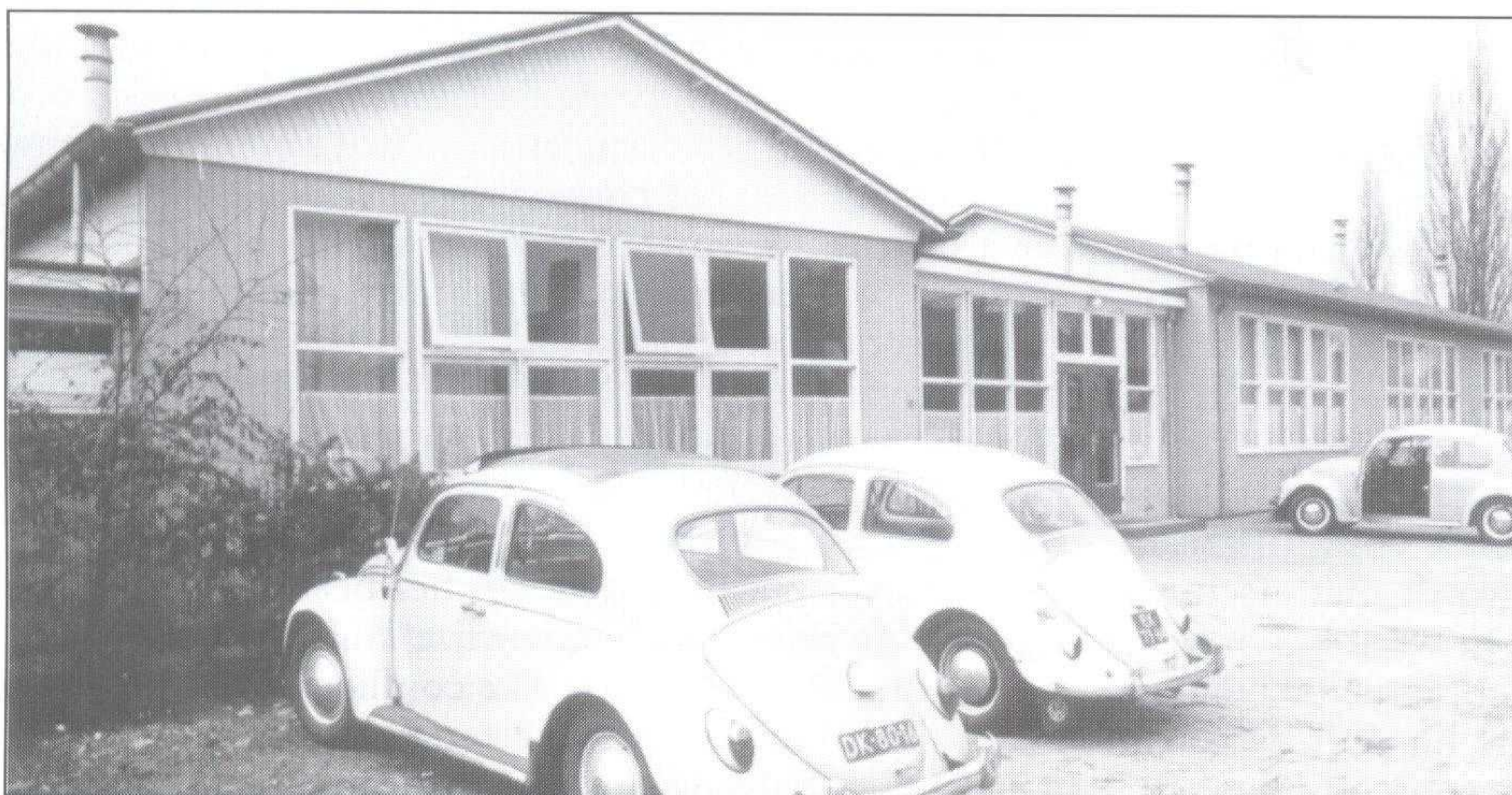
Ingang gebouw Irenelaan in 1970.

De regionale industrialisatie en de daarmee samenhangende explosieve bevolkingsgroei van zowel Ede als van de dorpen in de directe omgeving, evenals de verminderde belangstelling voor het beroepsonderwijs en de komst van het HAVO, zorgden ervoor dat zich jaarlijks bij beide Edese middelbare scholen ruim voldoende leerlingen aanmeldden. Het voortbestaan van zowel Marnix College als Streeklyceum was daardoor gewaarborgd. De vanuit de gereformeerde kerkenraad en het protestants-christelijke basisonderwijs 'geregisseerde' aantrekkingskracht van het Streeklyceum op het orthodox-protestantse volksdeel van Ede en omstreken bleek zo groot, dat via 441 leerlingen in 1966 (81) , het leerlingenaantal tien jaar later was opgelopen tot ongeveer 1400. Bovendien zorgde de school telkenjare via een streng selectiesysteem en degelijk onderwijs voor goede eindexamenresultaten, een gegeven dat veel ouders aansprak, ook van buiten de orthodox-protestantse gemeenschap.