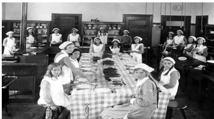
Kijkje in de keuken van het gebouw aan de Brouwerstraat (ca. 1935). De leerlingen droegen lichtgroene jurken, witte schorten en witte mutsen.