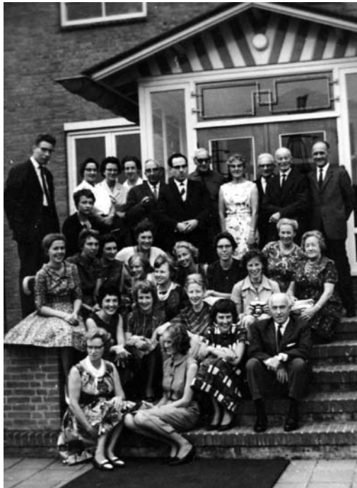
In 1961 werd het nieuwe schoolgebouw aan de Hendrik Stafweg geopend. Op de foto het bestuur en de docenten.

De inspectrice van het Nijverheidsonderwijs, mej.M.W.Schut stelde daarna het nieuwe schoolgebouw officieel in gebruik. 24 Zo nam de PMS afscheid van de Brouwerstraat en van de trouwkoetsjes die altijd langs de school reden. Zodra de leerlingen het rinkelen van de belletjes van het paardentuig hoorden, kwamen zij achter hun tafeltjes vandaan en holden naar de ramen om het bruidstoilet kritisch te beoordelen. Aan het bewonderen van de bruidjes was helaas een einde gekomen.