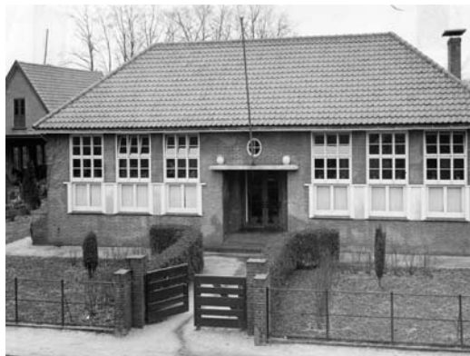
Het eerste schoolgebouw van de Chr. Landbouwhuishoudschool aan de Brouwerstraat (1931-1938)

Inmiddels waren er aan de dagschool meer dan 2000 leerlingen afgeleverd. Daarnaast had een groot aantal meisjes speciale cursussen of avondlessen gevolgd.