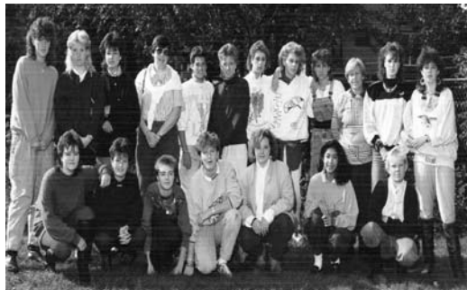
De eindexamenklas afd. Verzorging, 1987-1988)