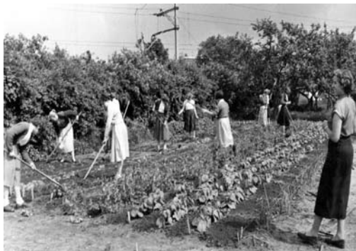
Praktijkles Tuinbouw naast het schoolgebouw aan de Brouwerstraat (1956)

jecteerde foto's een historisch overzicht van de afgelopen vijftig jaar. 17