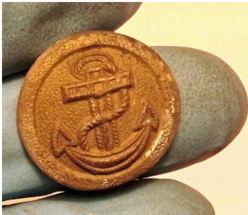
Knoop van de Kriegsmarine, Bergansius-kazerne

Tijdens het onderzoek in de Bergansius Kazerne werden knopen uit de Tweede Wereldoorlog of daarvoor aangetroffen.