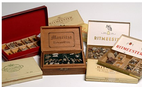
Zo is het begonnen!

Die omvat honderden stenen pijlpuntjes en scherven, maar ook oud aardewerk, klok-bekers en bijlen, grote maalstenen, Romeinse munten en middeleeuwse wijnflessen. Deze collectie is bijeengebracht tijdens 60 jaar intensief verzamelen. De verzameling vormt een uniek archeologisch document, dat het verhaal vertelt van duizenden jaren bewoning op en rondom de Veluwe.