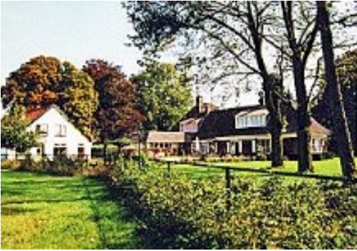
De Hindekamp anno 2000., Foto welwillend afgestaan door Frans van Oort

Dat het overgrote deel van de studenten zich prima in de bestaande democratische spelregels kon vinden, blijkt uit het feit dat het hier om de mening van slechts zeventien van de ruim 350 studenten ging.