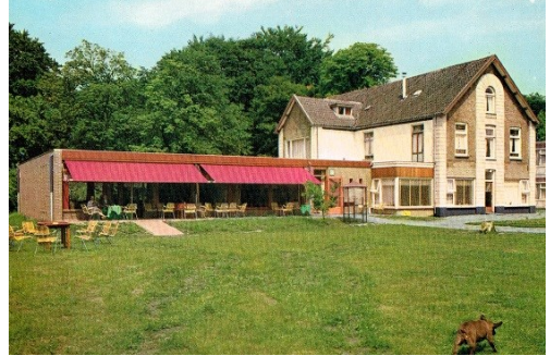
Vakantie en Conferentieoord Ingenetta aan de Bosrand

studenten stonden. In het jaarboek 1967/8 schreef de voorzitter van USRA over de onderwerpen van de beide lezingen van dat jaar: ‘De heer Griep kwam over de NVSH vertellen en de heer Versteeg ‘over de bloemetjes en de bijtjes’.