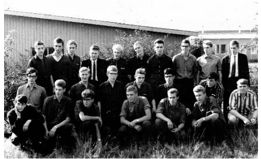
Zicht op de noodlokalen aan de Irenelaan. Op de voorgrond klas 1 van het jaar 1965/66

vaker gebeurt, is daar niets van terechtgekomen. Na het vertrek van de CHLS zijn de gebouwen gebruikt door het protestants-christelijk Streeklyceum. Uiteindelijk is het terrein volgebouwd met koopwoningen.