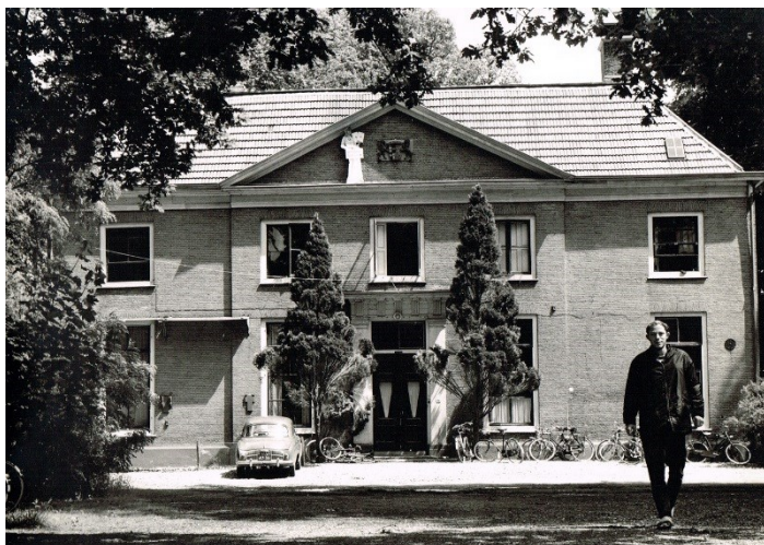
Internaat (1963-1968) Kernhem, Lunterseweg 9

De problemen die men een aantal jaren na de verhuizing naar Dronten met het internaat aldaar heeft gehad, hebben zich in Ede niet voorgedaan. De jubileumboeken reppen daar in ieder geval niet over. In Dronten voorzag men kennelijk minder gewenste toestanden, mede omdat daar de studenten zowel intern (in het internaat) als extern (in het dorp) gehuisvest waren; men sprak over het ‘internaat’ naast het ‘externaat’.