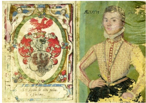
Wapen en portret Carel van Arnhem

Hieronder volgt een afbeelding van wapen en portret op de openingspagina van het wapenboek.