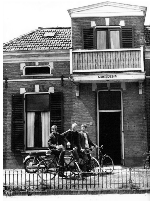
Tijdelijk internaat in Mon Désir (1966-1968), Grotestraat 116, afgebroken in 1970

70%. In getallen uitgedrukt, betekende dit dat in 1963 100 leerlingen intern waren, in 1968 al 200.