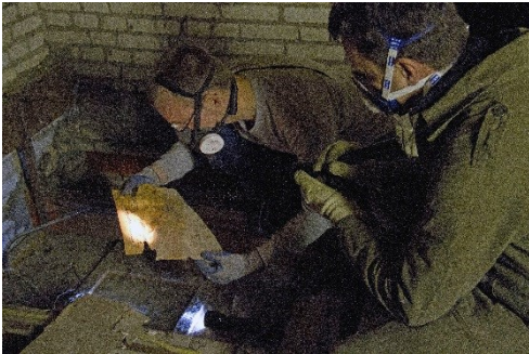
Een impressie van het onderzoek in de Beeckmankazerne.

De methode is nog experimenteel en onderzoekt de materiële neerslag van gebruikers in gebouwen . Bouwbiografie kijkt dus niet naar het gebouw zelf, maar naar de sporen van mensen, zoals zoekgeraakte of vergeten bezittingen, verstopte of achtergelaten documenten, verscheurde brieven, slijtage op deuren, inscripties op muren en nog veel meer. Belangrijk om daarbij te beseffen is dat het meestal niet