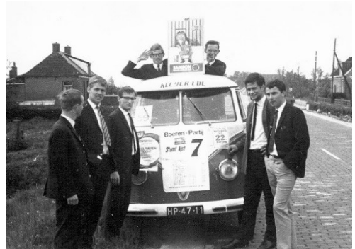
Ludieke actie van CHLS studenten voor de Boerenpartij van Hendrik Koekkoek

'Dronten' betekende een unieke kans om de opleiding te verbeteren en het nog steeds groeiende aantal studenten op te vangen. Nu was de polder niet direct het plekje Nederland dat elke leraar en medewerker van de school graag voor de Veluwe wilde inruilen. Voorzichtigshalve organiseerde men in april 1963 een excursie naar Dronten. Het zat de organisatoren niet mee. Het was een gure, winterige voorjaarsdag, het regende de hele dag pijpenstelen. Het hemelwater en de modder dreigden de lust om te emigreren naar de polder negatief te beïnvloeden. Dat viel gelukkig mee; toen de school in 1968 verhuisde, zijn slechts enkele medewerkers op de Veluwe achtergebleven.