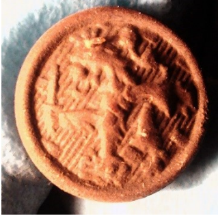
Knoop van het Nederlands uniform van vóór 1940, Bergansius-kazerne

Zoals gezegd zijn er in de kazernes ook delen van uniform en uitrusting opgedoken. Twee van de wat oudere vondsten worden hier genoemd.