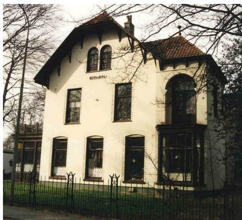
De villa Berg en Dal aan de Stationsweg

hun basisopleiding hadden gedaan. Aan deze Hogere Landbouwscholen was toen geen L-opleiding verbonden.