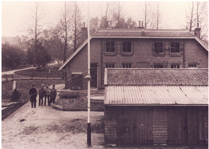
Politiebureau aan de Artillerieaan 1940–1946, Foto: Gemeentearchief GA 14716

Jan, 34 jaar oud, werd verhoord in zijn 'slaapkamer' op het politiebureau. Hij werkte eveneens bij de ENKA en was belast met het stuksnijden van droge zijde om daarmee dekens te vullen. Hij stond daarvoor bij een elektrisch gedreven rond mes. Als hij met dat werk bezig was, zaten zijn handen en kleren vol met zijdevlokken. Zijn voorman vond hem een goede werkkraacht.