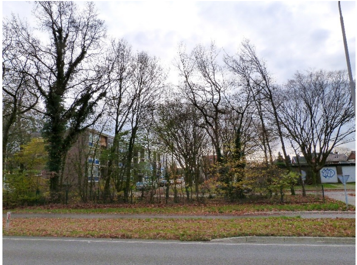
Plaats delict anno 2012

op de bel en op de lamp. Op de bovenstang van het frame zat niet alleen bloed, maar ook hoofdharen. Op de onderkant van het frame stond tegen de trapas een zakje met vijf koekjes, terwijl een zesde stukje buiten het zakje op de grond was gevallen en een bloedspat vertoonde. Op het zakje zelf bevonden zich ook enige bloedspatten. Het slachtoffer had erg uit de wonden aan zijn hoofd gebloed, zodat onder zijn achterhoofd een bloedplas was ontstaan. In het gras van de wegberm viel een spoor van een fiets richting de Stompekamperweg op. Vermoedelijk had het slachtoffer geremd voor hij werd aangevallen, want aan het eind van het spoor was een slipspoor in de grond te zien.