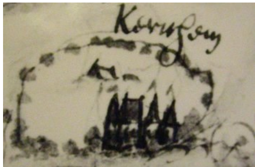
Fragment uit kaart van de buurtschap Doesburg. Getekend door Nicolaes van Geelkercken in 1665

De periode na 1650, nadat de heren van Wassenaer van Obdam Kernhem hadden verworven, vormt geen probleem.