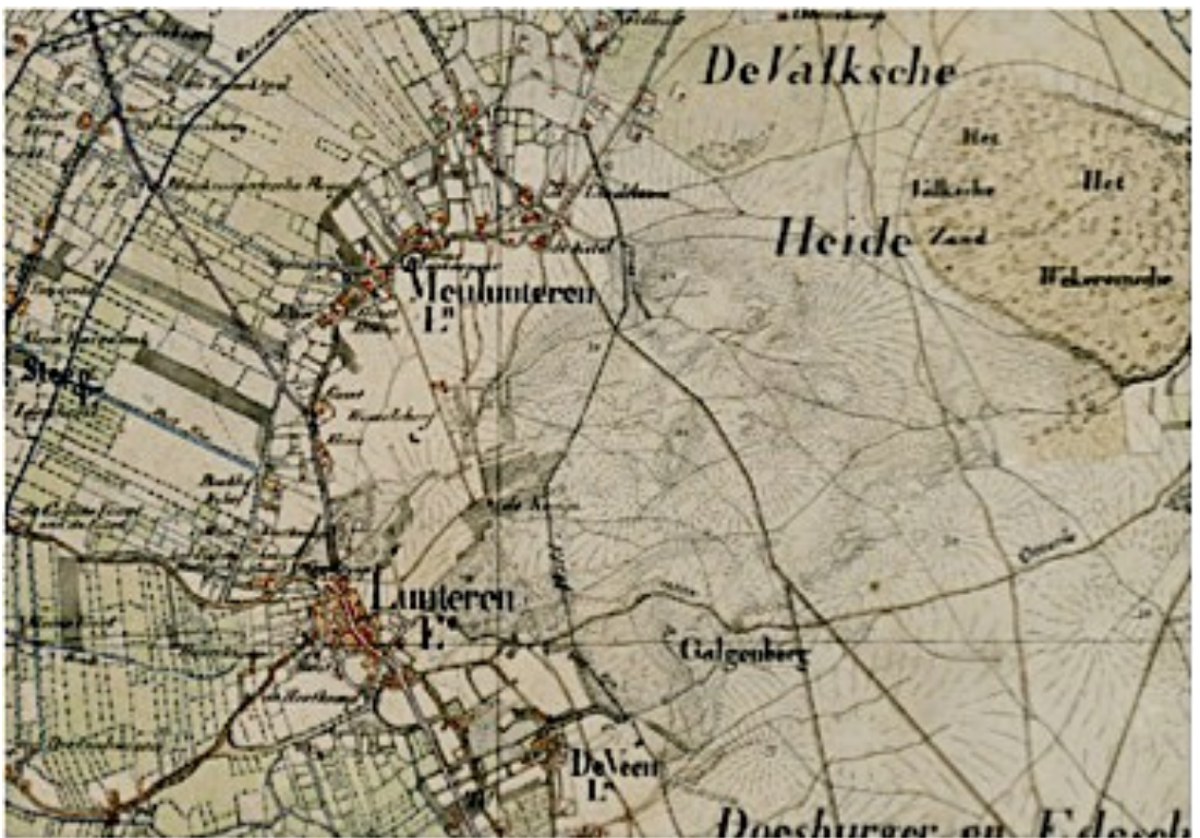
De ligging van de wildwal in de heide bij Lunteren, kan het resultaat zijn van de uitgifte van woeste gronden in de 14e eeuw. Hierbij fungeerde de wal naast wildkering vooral een grensafbakening.

Vooral in aaneengesloten heidegebieden heeft deze uitgifte tot problemen kunnen leiden. De graaf moest immers goed duidelijk hebben welke gronden hij in tyns had uitgegeven, en welke nog in zijn bezit waren. Helemaal wanneer de heideterreinen niet meteen werden ontgonnen, maar eerst werden gebruikt om bijvoorbeeld plaggen te