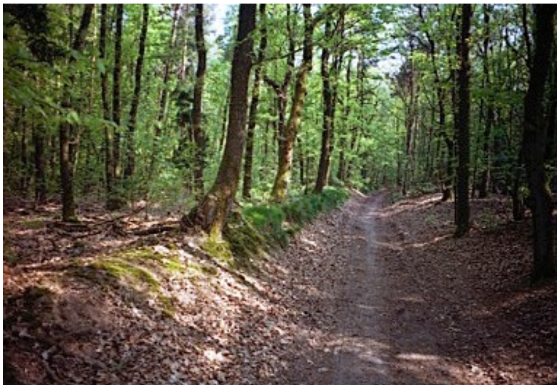
Wildwal ter hoogte van de Beukenlaan in Lunteren.

Een blik op de 19e eeuwse topografische kaarten geven voor het overgrote deel inderdaad dit beeld weer. Voor extra zekerheid zijn er op verschillende plekken langs de wildwal grondboringen verricht. Het landgebruik is door de eeuwen heen namelijk zeer veranderd, waardoor de kaarten een vertekend beeld kunnen geven. De bodem is veel meer statisch, zodat hier een veel nauwkeuriger beeld kon worden achterhaald. (Voor zover we weten is de wal op de oorspronkelijke bodem opgeworpen,