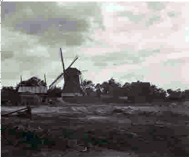
De egalisering in 1957 van het terrein achter de molen aan de Dorpsstraat te Lunteren, begrensd door de Dorpsstraat, Mielweg en Molenparkweg, tot industrieterrein. Op dit terrein werd vroeger het traditionele paasvuur ontstoken.

In de jaren twintig van de vorige eeuw groeide het Lunterse paasvuur uit tot een belangrijk plaatselijke gebeurtenis, georganiseerd door de besturen van VVV, middenstands- en Oranjevereniging. Mede door