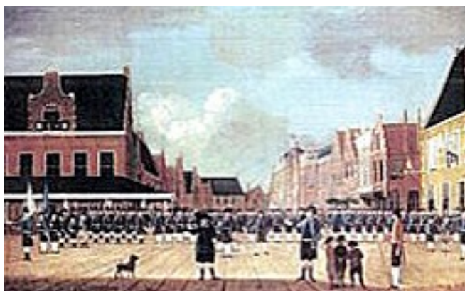
Het Exercitiëgenootschap van Sneek (1786), door Hermanus van de Velde. Fries Scheepvaart Museum, Sneek

Duidelijk mag zijn dat de schutters alleen optraden bij het uitbreken van opstootjes of erger.