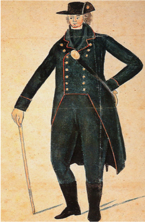
De ambtskleding van een veldwachter (1815) [122544021]

Pas in de loop van de 19e eeuw kwam er een langzame stijging van de lonen op gang.