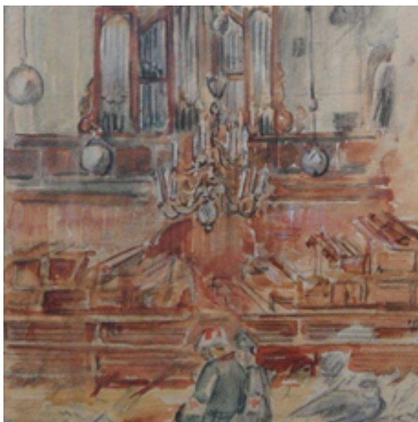
Dit is het schilderijtje dat ds. de Bruijn kreeg voor zijn verjaardag in 1944. Het is het interieur van de kerk met gewonden en vluchtelingen

landse bezette gebieden onder grote druk te zetten. De Duitsers verwachtten de aanval niet meer vanuit het zuiden over de Veluwe, maar vanuit Overijssel.