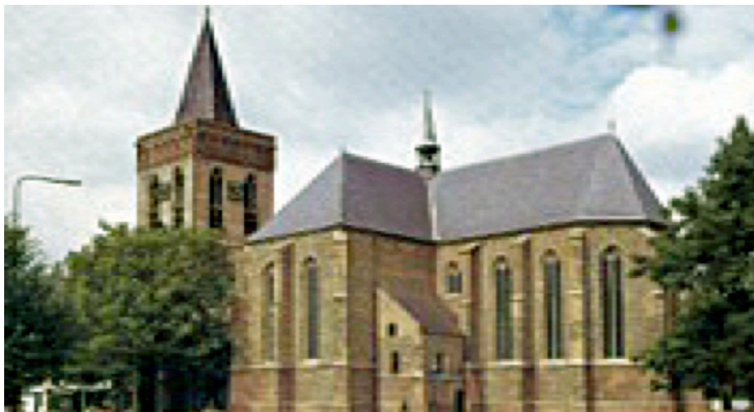
Oude Kerk, Ede

In de kerkelijke gemeente gaan dan ook veel stemmen op om, op de één of andere manier, aan deze 'treurige toestanden' een eind te maken.