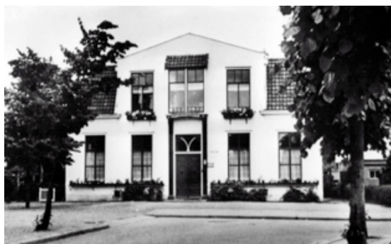
De pastorie van Otterlo

De slag om Arnhem was inmiddels in alle hevigheid uitgebroken. Slechts 600 soldaten, onder leiding van luitenant-kolonel John Frost, bereikten de Rijnbrug. Na vier dagen zware strijd moesten zij zich op donderdag 21 september overgeven aan de Duitsers. Arnhem had in die tijd drie ziekenhuizen, waaronder het St. Elisabeth Gasthuis dat zelf in de frontlinie lag en al snel veranderde in een militair hospitaal. Op 19 september werd besloten de meeste burgerpatiënten te evacueren naar het Diaconessenhuis.