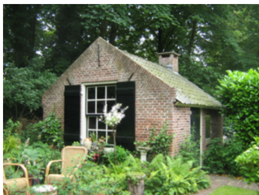
Foto bakhuis, genomen met toestemming huidige eigenaar, juli 2013

De boerderij gaat ook dienst doen als museumruimte. Het onderhoud door de eerste bewoners (huurders) laat sterk te wensen over. Wanneer deze vertrekken, is dat voor beide partijen een verbetering. De nieuwe bewoners, die er begin 1940 komen wonen, voldoen veel beter. Na verloop van tijd wordt vastgesteld dat de bewoonster (tot wederopzegging) alle entreegelden mag houden als vergoeding voor de begeleiding van de museumbezoekers.