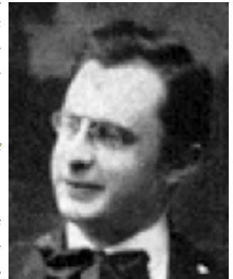
Jean-Louis Pisuise (1880-1927)

Halfweg Ede begon de ellende. Van druppels was de regen