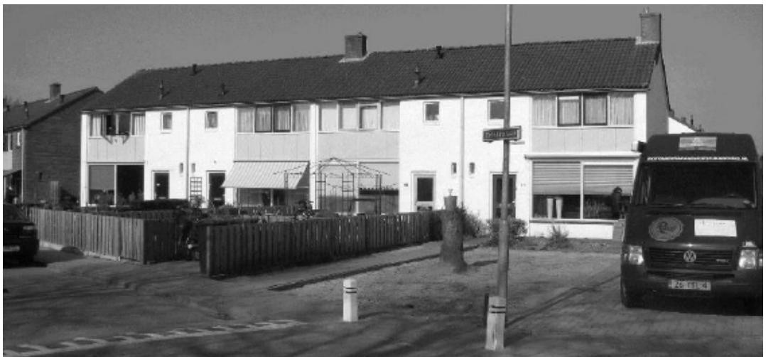
Foto 3: Woningwetwoningen Celebeslaan, 2015

De straatnamen in de wijk zijn eind 1947 vastgesteld en vernoemd naar Indonesische eilanden. Een reden voor de keuze is niet gevonden; mogelijk speelde de politieke situatie van dat moment een rol, maar wellicht ook de repatriëring van veel Nederlanders uit Nederlands-Indië die vooral in 1946 had plaatsgehad. De