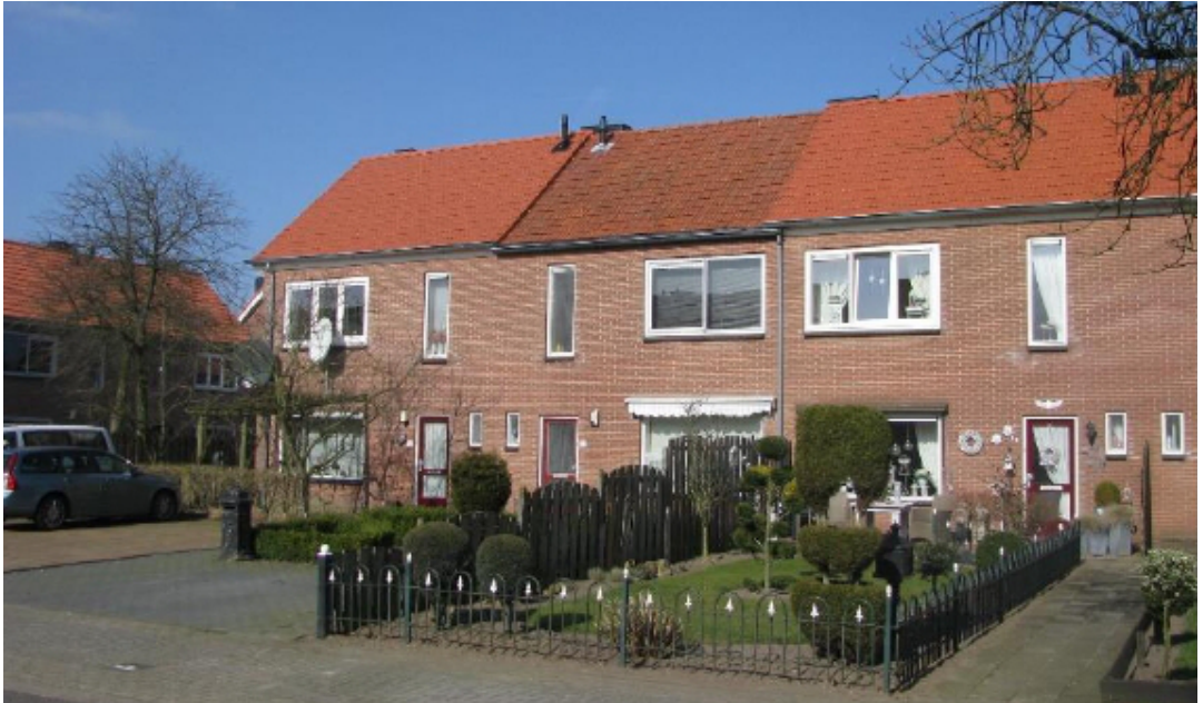
Foto 4: Javalaan in 2015 met gerenoveerde montagewoningen, één woning heeft geen dakisolatie.

namen waren in het raadsvoorstel goed weergegeven, maar de naam van het eiland Flores werd op tekeningen en straatnaamborden al snel ingewisseld voor de bekende held Floris . Het zou tot 1962 duren alvorens de raad opnieuw de naam vaststelde als Floreslaan .