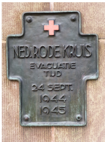
Gedenkteken van het Rode Kruis na de oorlog aangeboden aan de bevolking van Otterlo