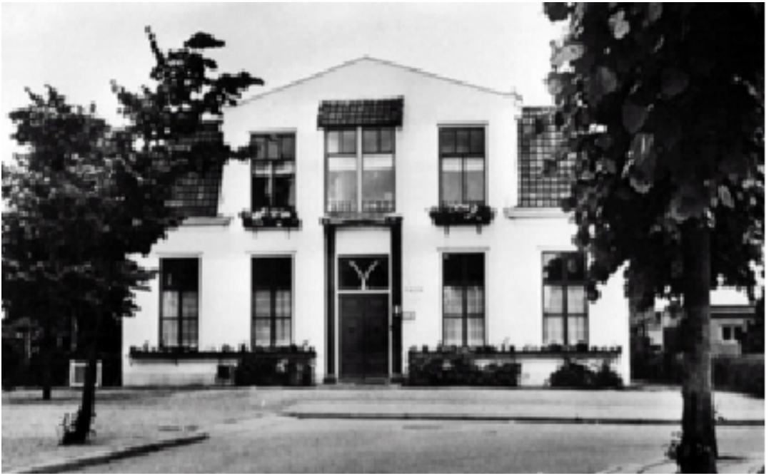
De pastorie, rond 1970 verbouwd/uitgebreid tot het verenigingsgebouw Eben-Haëzer.

De Transport Colonne van het Rode Kruis was aanvankelijk een wijdse naam voor weinig middelen n.l. een 4-ton's truck en enkele dokters(personen)auto's. Zij werd belast met het vervoer van de zieken, bedden en andere middelen. Omdat er veel meer vervoerscapaciteit nodig was vorderde het Rode Kruis in Arnhem paarden en wagens. Zo kreeg zij op zondag 24 september dertig platte wagens bijeen voor de verhuizing van het Diaconessenziekenhuis en het Kinderziekenhuis. De meeste patiënten van het Elisabeth Gasthuis waren reeds eerder binnen Arnhem naar het Diaconessenziekenhuis verplaatst. Het Gemeenteziekenhuis te Arnhem was door de Duitsers voor eigen gewonden 'gefordert' als 'Kriegslazaret'.