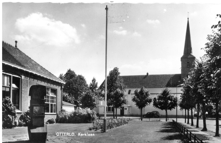
Otterlo, Kerklaan en kerk

den ook maar beperkte voorraden. De Transportcolonne heeft een aantal ritten naar Groningen gemaakt om (aardappelen) te halen. Ook zijn er berichten dat Rode Kruis-mensen aardappels gingen rooien op door boeren verlaten percelen in of langs de rand van het verboden gebied (sperzone).