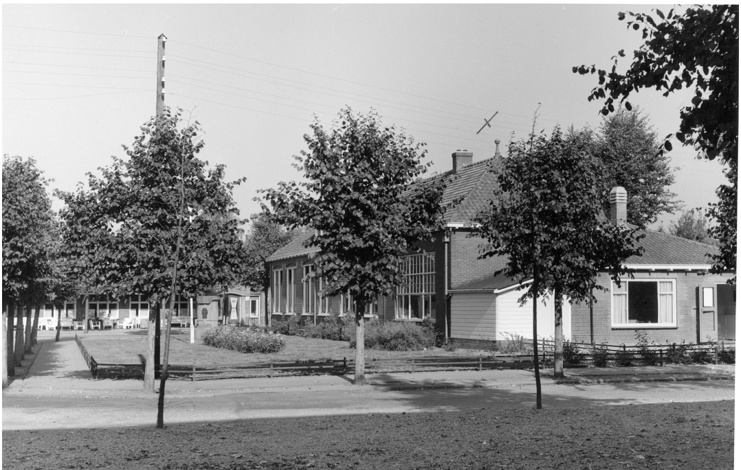
De Ericaschool

Dagelijks werden tegen het middaguur met paard en wagen de gamellen met eten van de gaarkeuken naar het museum vervoerd. Ook gingen vaak doodskisten, gemaakt door timmerman Beumer, op de wagen mee. Hijzelf ging in de ochtend vooraf op de fiets naar het museum om te horen of en hoeveel kisten er geleverd moesten worden. In het voorjaar werd door schaarste aan hout een deel van de kist in karton uitgevoerd. De doden werden op de terugweg meegenomen naar het kerkhof van Otterlo.