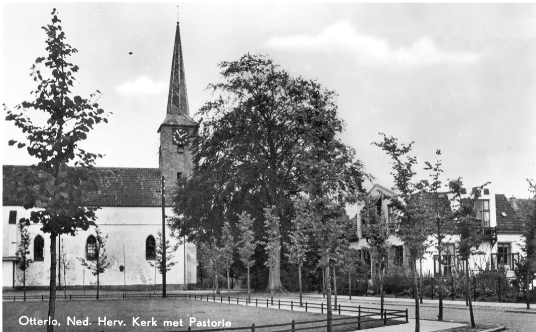
Otterlo, Ned. Herv. Kerk met Pastorie

De bevolking van dorp en naaste omgeving was toen ongeveer verdrievoudigd.