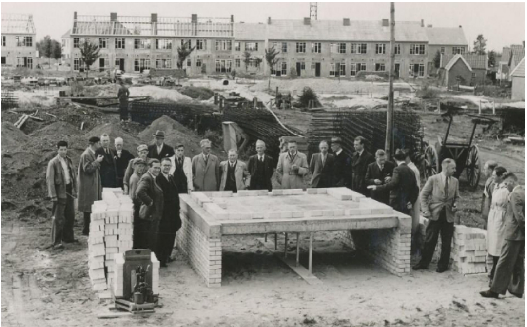
Foto 1: Begin van de bouw van de Javalaan, november 1947, met bezoek van de minister (GA15401)

Nederland en ook Ede kwamen gehavend uit de oorlog. Ede was qua oppervlakte de op één na grootste gemeente van Nederland, met toen ongeveer 40.000 inwoners verdeeld over zeven dorpen en het buitengebied. In het dorp Ede woonden ongeveer 18.000 mensen. In 1944 waren er echter ook nog evacuees gekomen uit