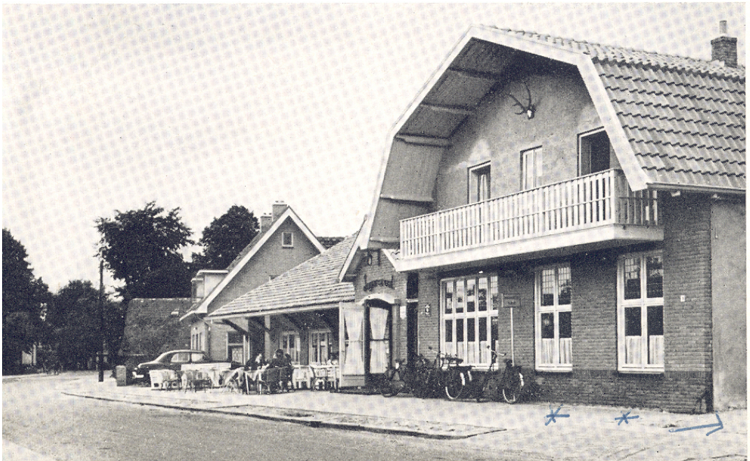
Café Jagerslust (foto 1950, Gemeente Archief Ede GA12750)