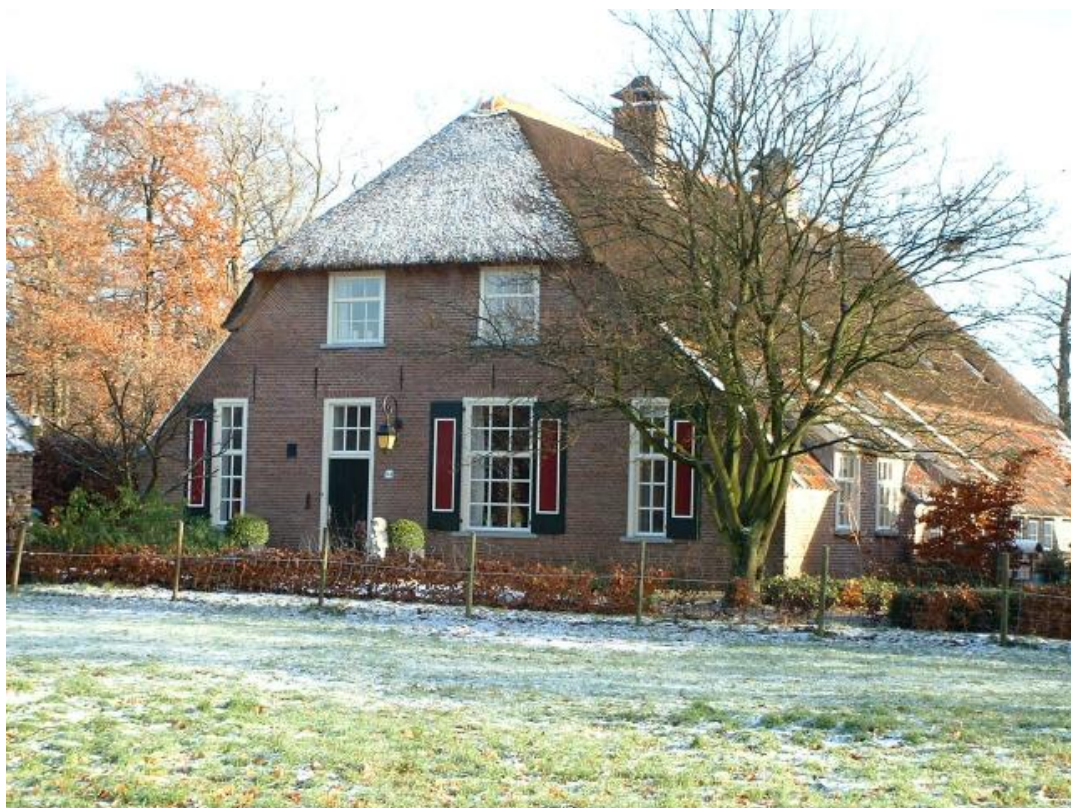
Boerderij De Slijpkruik, historisch monument

In 1359 werd het bezit van de hertog van Cleef (nu Kleve) verkocht. Tot dat bezit behoorde ook boerderij De Slijpkruik. De nieuwe eigenaar werd hertog Johan, heer