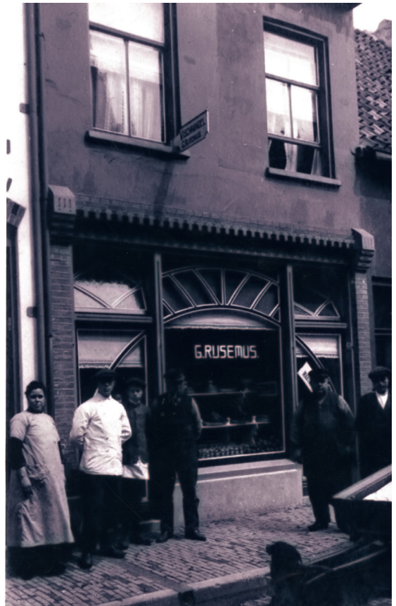
Het pand Junusstraat 12 in Wageningen waar de geschiedenis van de vishandel is begonnen.

Godefridus is in 1933 overleden. Zijn vrouw verhuist daarna naar de Hoogstraat nr. 80 en trekt in bij een zoon en