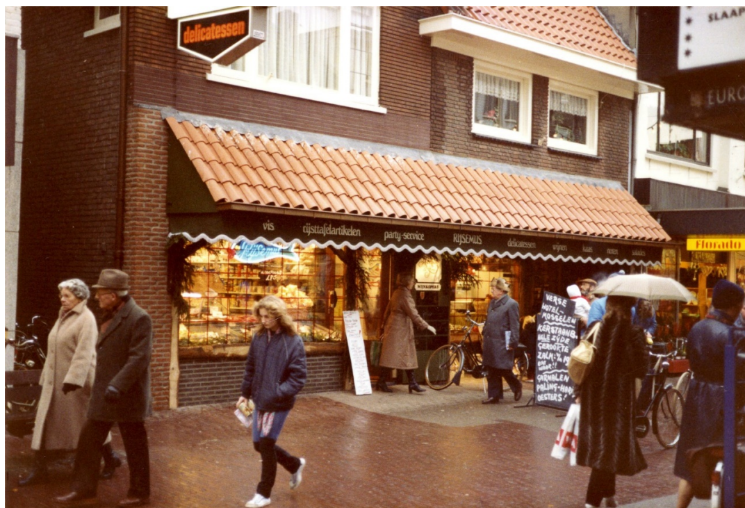
Beide winkels aan de Grotestraat, zoals ze er rond 1984 uitzagen. Links de viswinkel, rechts de delicatessenzaak.

Vanaf dat moment storten de gebroeders Rijsemus zich met Wim de Frel ook op het samenstellen en verkopen van kerstpakketten. Kerstpakketten hebben ook al deel uitgemaakt van de delicatessenwinkel. Het vullen hiervan loopt van november tot aan de Kerst. In den beginne is de opslag van deze pakketten aan de Kamperfoelielaan, maar de groei zit er in die jaren goed in; in krantenberichten wordt gemeld dat er in 1990 zo'n 55.000 pakketten worden samengesteld en door geheel Nederland en zelfs over de landsgrenzen vervoerd. Elke opdrachtgever bepaalt hoe de inhoud van het pakket wordt samengesteld en welk verpakkingsmateriaal daarvoor wordt gebruikt. Ook daarvan is een ruime sortering aanwezig zoals