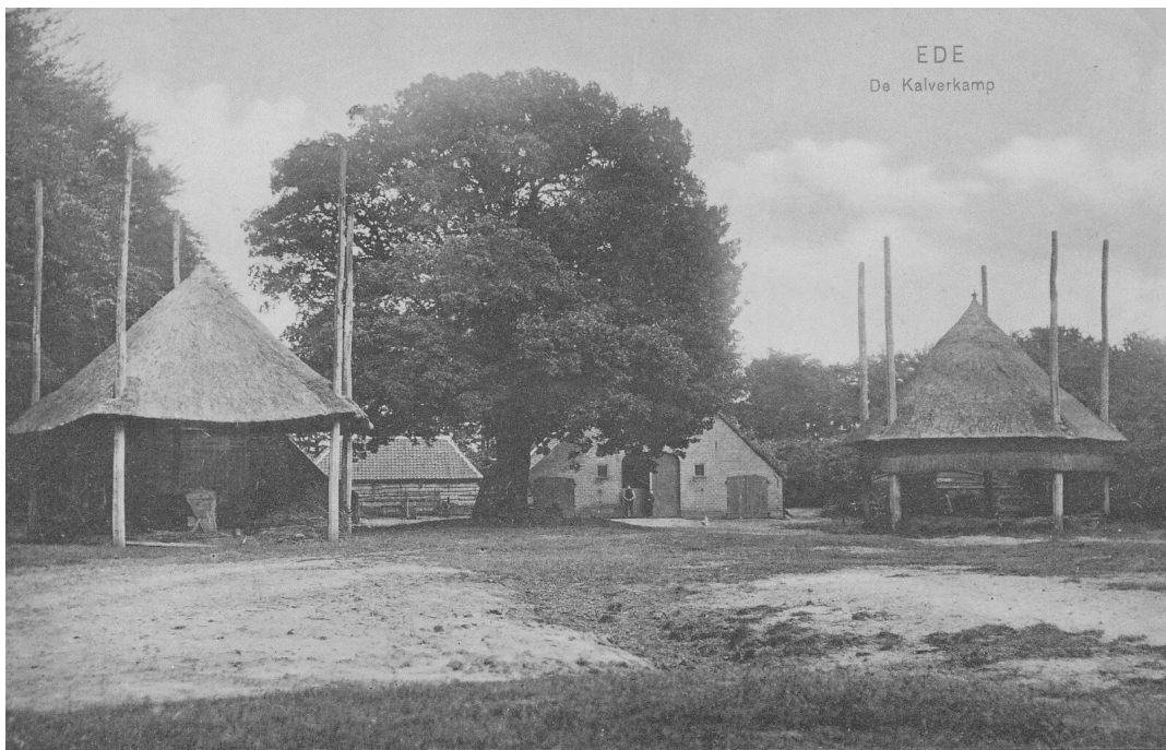
Boerderij Bouwhuis. Foto uit ca. 1910. Hierop zijn nog duidelijk de twee vijfroedige hooibergen te zien. Ook de monumentale eik, nog steeds aanwezig, is zichtbaar. Op deze prent staat ten onrechte aangegeven dat dit boerderij De Kalverkamp is. (Foto collectie F.G. van Oort).

Op het achtererf bevindt zich een monumentale solitair staande eik. Oorspronkelijk stonden op het achtererf twee vijfroedige hooibergen.