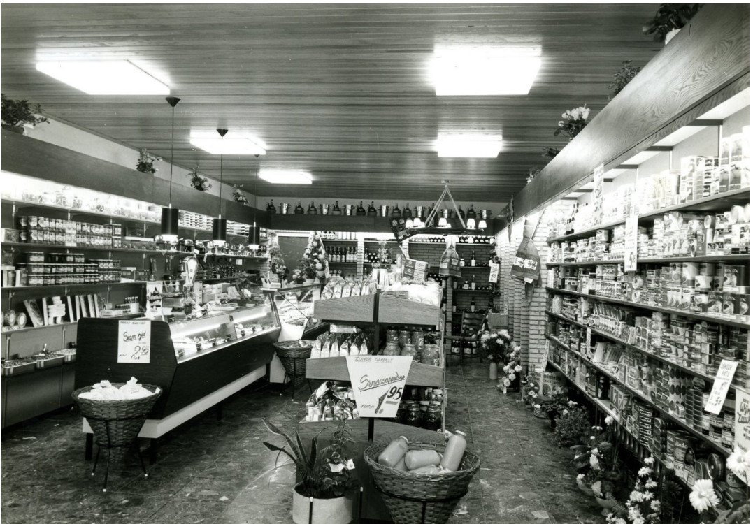
De delicatessenwinkel na de opening in 1967. Er is een flink assortiment te zien. Achter in de zaak is al een deel ingericht voor de wijnverkoop