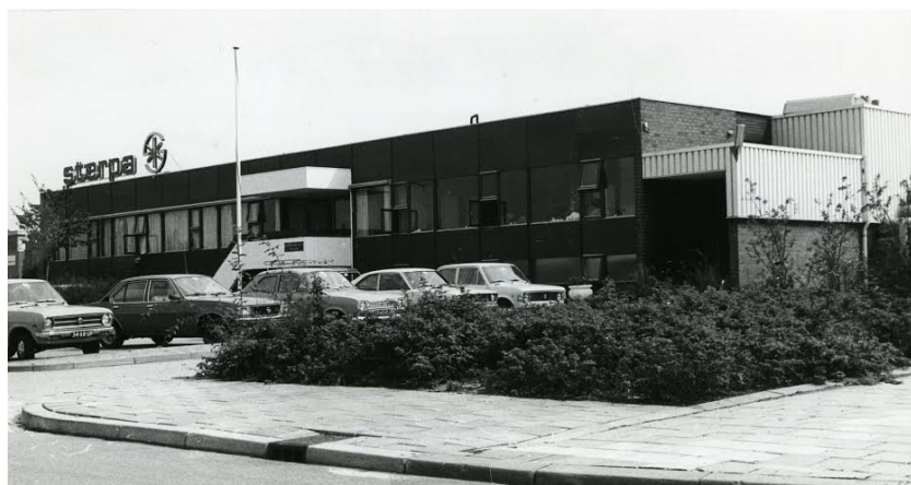
De Sterpa-vestiging aan de Spinderweg. Een foto uit 1976.

Door de samenvoeging van de twee bedrijven is uitbreiding van capaciteit nodig. Voor een deel is dit mogelijk in de bestaande fabriek. Hierin is, door het reeds aanbrengen van complete roestvrijstalen productielijnen en aangepaste wanden, vloeren en ventilatie, een vlotte start gegarandeerd. Ook zijn installaties geplaatst om het conserveren van grote hoeveelheden mogelijk te maken. Naast het bestaande fabrieksdeel wordt het complex verder uitgebreid, tot een totale oppervlakte van