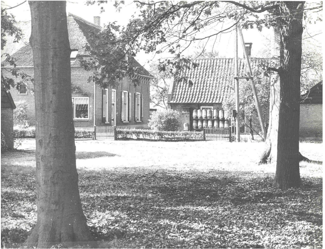
Boerderij De Kalverkamp. Foto gemeentearchief nr. RE31667

In 1996 wordt de boerderij in gebruik genomen als zorgboerderij Makandra . Deze naam betekent in het Surinaams 'met elkander'. Het is een biologische boerderij die dagopvang biedt aan mensen met een verstandelijke beperking en mensen met een lichamelijke handicap. In de huiswinkel worden eigen biologische producten verkocht. Zij verkopen fruit en groente van het seizoen, honing, biologische eieren, Remeker-kaas en biologisch vlees van Jersey-koeien.