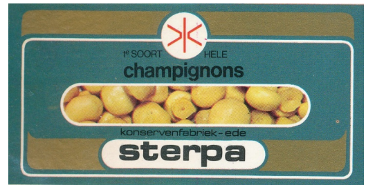
Twee etiketten uit de Sterpa-periode.

zesduizend vierkante meter. Voor de opslag van de gereedgekomen producten zullen drie hallen worden aangebouwd met een gezamenlijke oppervlakte van 1.800 vierkante meter. Tevens wordt de laad- en losgelegenheden voorzien van een overkapping. Vóór het gebouw is al ruimte vrij gemaakt voor het bouwen van onder meer een kantoor en de kantine.