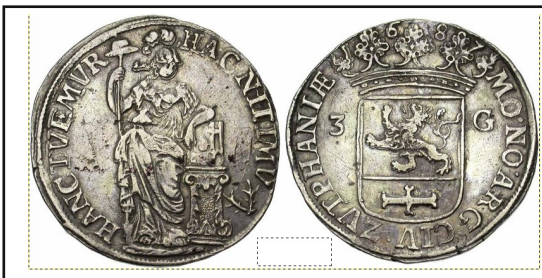
De Nederlandse Maagd op een Zutphense 3-guldenmunt uit 1687

Van de Waal schreef over de Nederlandse Maagd: De oorsprong van de