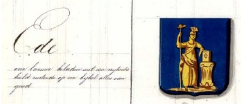
Het wapen van de gemeente Ede in het Wapenregister van de Hoge Raad van Adel