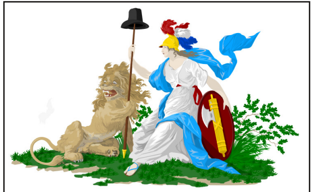
Het wapen van de Bataafsche Republiek

Ambt, is vervaardigd. Dat was in de tijd van de Patriotten en het ontstaan van de door Frankrijk gesteunde Bataafsche Republiek. Het wapen van die Republiek is een combinatie van de Franse vrijheidsmaagd ( Marianne ), met een door een vrijheidshoed gedekte speer. Zij wordt vergezeld door de Nederlandse leeuw, en houdt met haar linkerhand een schild vast met daarop het symbool van de republiek: een bundel pijlen met een bijl. (Dit zou, o ironie der geschiedenis, later het fascistensymbool worden).