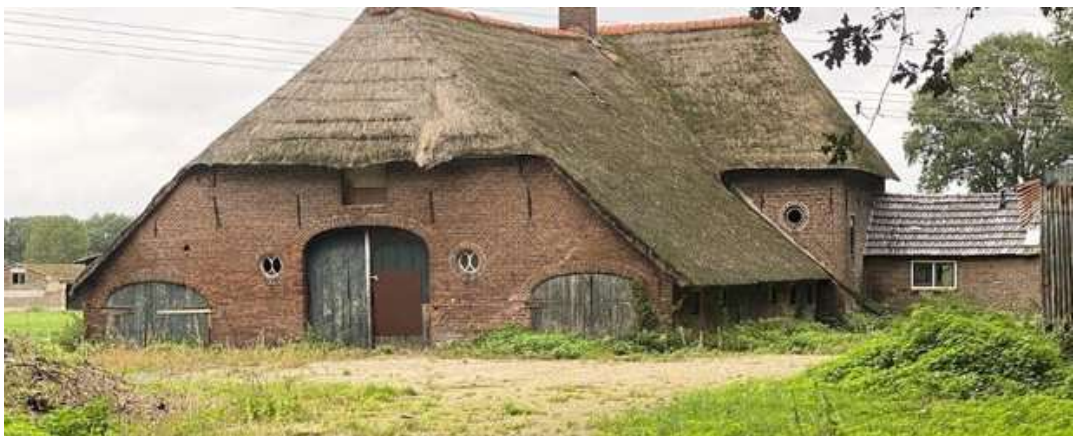
Rijksmonument boerderij Pothoven aan de Lunterseweg