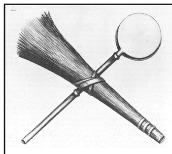
Roede en plak

In 1851 telde de school 179 leerlingen; in 1900: 388. Om die massa in het gareel te houden, mochten de meesters volgens een officieel voorschrift gebruik maken van de plak en de roede. De plak was een houten latje, soms in de vorm van een pollepel en de roede, een bundeltje takken. Wie de orde verstoorde, kon rekenen op een stevige tik met de plak op zijn handpalmen of een paar klappen met de roede voor zijn broek.