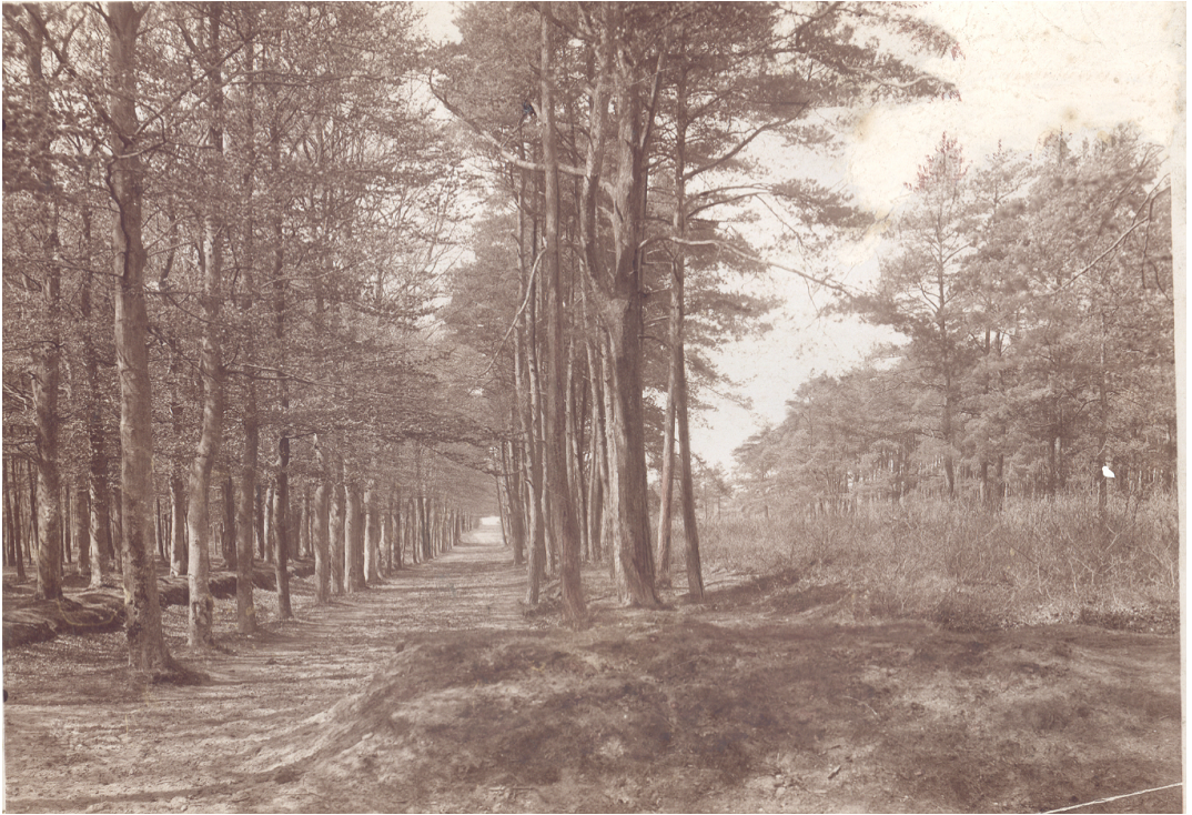
Edese Bos: Hoog opgaande beuken langs de Doolhoflaan (GA11493)