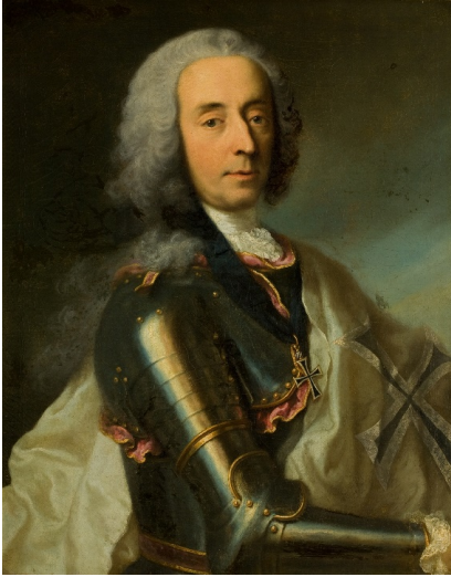
Portret van Unico Wilhelm van Wassenaer-Obdam 1692-1766, door Georges Dèsmarées

met de grootte van het erf en de beschikbare ruimte. Jaarlijks moesten er 50 telgen gepoot worden voor een vol erf en 25 voor een half erf. De kuilen moesten tevoren gegraven zijn, vier voet in het vierkant en in diepte variërend naar mate de grond hoger of lager lag. De bodem moest goed geroerd (losgemaakt) worden. Op hoge, losse grond moesten de kuilen bepoot worden in het najaar, op vochtige, lage grond in het voorjaar. Tevens moesten zijn arbeiders jaarlijks een groot aantal telgen poten op goede grond zonder acht te slaan op eventuele protesten van de pachter. Grond die niet geschikt was voor eiken, moest met dennen bepoot worden. Eiken hadden echter de voorkeur, omdat het hout geschikt was als timmer- en geriefhout voor arbeider en boer, maar ook voor de scheepsbouw. Bovendien gaf de eik goed brandhout – in tegenstelling tot de den – en kon de schors dienst