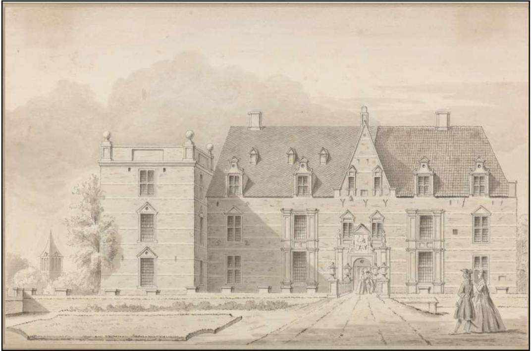
Twickel 1729

vandaar zijn aandringen om meer aandacht te besteden aan verjonging van het bos. Waar haalde Brill deze ideeën vandaan? Het voor de hand liggende antwoord luidt: vanuit zijn ervaring met het landgoed Twickel. Hoe was op Twickel de omgang met het bos geregeld? Valt hier iets te vernemen van de invloed van de heren van Kernhem op het bosbeheer?