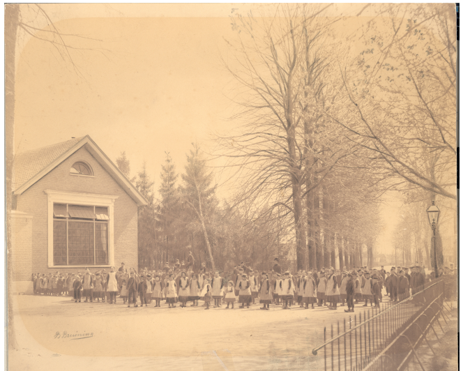
Openbare Lagere School aan de Dorpsstraat te Lunteren (foto 1890, GA13224)