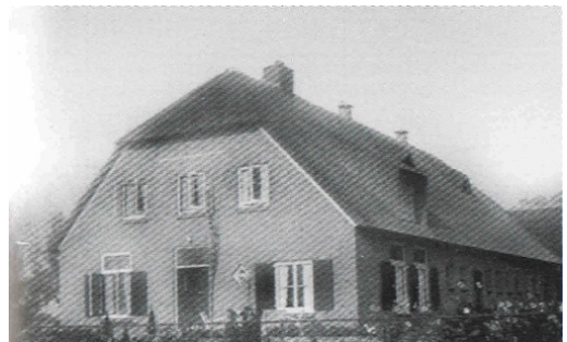
Boerderij De Wester Wetering in 1938

De Trapakkers de gemeenteraad van Ede gevraagd de boerderij de Wester Wetering aan de Rijksweg/N224 aan te wijzen als gemeentelijk monument. Dat verzoek was ineens nodig, omdat op de agenda van de gemeenteraad het voorstel stond om het gebied vanaf de Heestereng tot aan de Kade in de toekomst om te vormen tot industriegebied, met inbegrip van deze boerderij. Het is een bijzondere boerderij: monumentaal en twee keer een