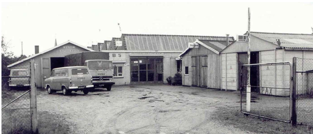
Bunschoterweg 27 (ca. 1974)

In 1950 vestigde zich een kleine bandenfabriek aan de Bunschoterweg 27. Het bedrijf met de naam Hopax (een samentrekking van de namen van de twee directeurs J.R. ten Hoopen en S.C.M. Bax ) was afkomstig uit Delft, waar geen uitbreidingsmogelijkheden waren.