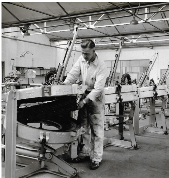
Covermachine (ca. 1950)

In 1950 werd ook de verkoop gereorganiseerd. Een landelijk dekkend team van