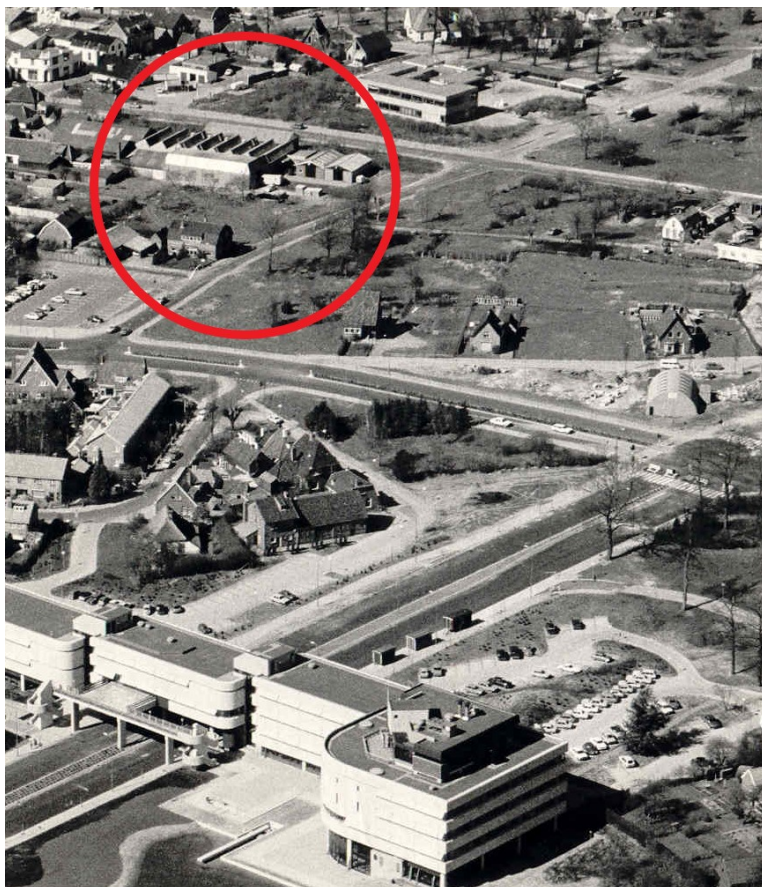
In de cirkel Vulcano aan de Frankeneng (1987)