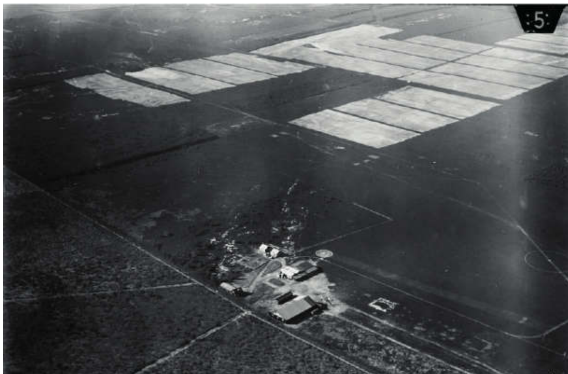
Vliegekamp Ede rond 1920

tiegasten en omwonenden er als tennisbaan dankbaar gebruik van gemaakt. Later is ook het beton verwijderd en is er niets meer wat verwijst naar het vliegekamp dat daar ooit was. Zo kwam er een einde aan het korte, maar turbulente bestaan van vliegekamp Ede.