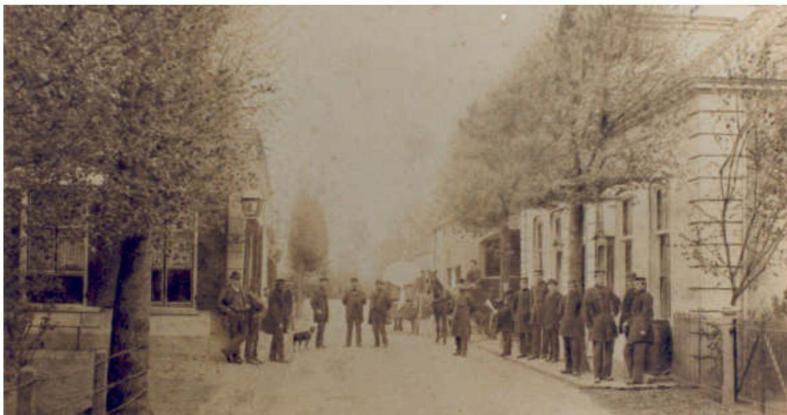
Notaris Fischerstraat; links: De Posthoorn, rechts: gemeentehuis. Voor het gemeentehuis staan alle veldwachters en ambtenaren - foto 1885 (GA16658).

aantal inwoners geleidelijk toenam, bleef het aantal dienders gelijk. Voor ongeveer f 4.- per persoon per week handhaafden zij orde en veiligheid. Geen vetpot. Vandaar dat zij probeerden wat extra inkomsten te verwerven. Dat lukte; bij de boeren haalden zij eieren en zij brachten almanakken rond. Toen de gemeenteraad daar achter kwam, werd het eieren halen verboden. Gelukkig kwam de raad hen tegemoet door hun traktement met f 7.- per jaar te verhogen. De almanakken mochten zij rond Nieuwjaar nog wel verspreiden.