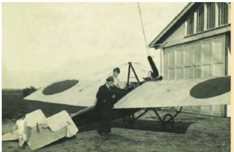
Sportvliegtuigje van Carley voor hun loods in Ede

Als Carley in 1921 vertrokken is, vallen de hangars en andere gebouwen in slopershanden; de betonvloeren laat men gemakshalve maar liggen. Jarenlang hebben vakan-