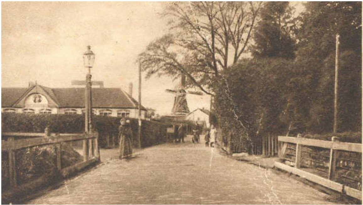
Gaslantaarn hoek Telefoonweg-Veenderweg; op de achtergrond de Cavaljéschool en de Concordiamolen - foto ca. 1916 (GA11822)

avond als nachtwacht, klepperman en lantaarnopsteker dat het althans op enkele plekjes in het dorpscentrum niet al te donker werd. Hij begon zijn ronde bij de woning van dokter Weijer aan de Bergstraat nr.1. Om elf uur moesten ook de minder brave Edenaren naar bed en kwam Gaart de lichten doven, behalve bij het huis van de dokter.