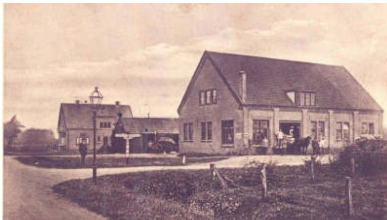
De enige lantaarn in Wekerom - foto ca. 1925.

Erg uitgebreid was het verlichtingsnet niet en veel werd er ook niet bijgeplaatst. In 1871 stond in het centrum van het dorp Ede, het Boschpoortgebied, zeggende en schrijve één lantaarn. Dat was al heel wat, vergeleken met enkele buitendorpen waar nog minder dan één stond. In 1871 vond een 'substantiële' uitbreiding plaats: in Ede, Bennekom en Lunteren kwam er één lantaarn bij en in Gelders Veenendaal, toen nog deel van de gemeente Ede, zelfs twee.