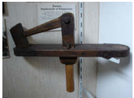
Klep (Museum Buren en Oranje)

Zulke zaken pakt men in Ede graag zeer degelijk aan en dus werden er op den duur zelfs twee nacht-