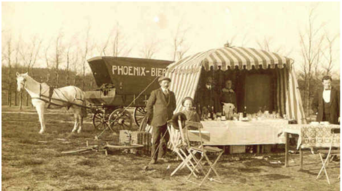
Ook aan de bezoekers werd gedacht (en verdiend!)

Doesburgerbuurt (Kippenlijn) rechtstreeks naar het vliegveld. Kostbare projecten waar men van afzag, toen de vliegbelangstelling in de jaren na 1910 vrij snel verflauwde. Om de onderneming toch financieel haalbaar te maken, werd besloten de publieksactiviteiten te concentreren op vlieggkamp Soesterberg, het tweede terrein van Verwey en Lugard, dat voor het publiek gemakkelijker te bereiken was.