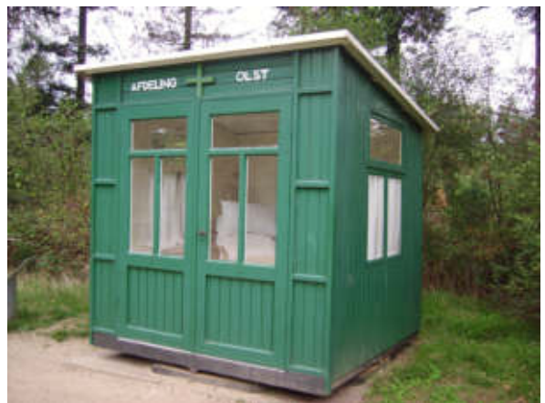
Tbc-huisje te Olst. De patiënten lagen het hele jaar overdag in een huisje. Op een speciaal onderstel kon dit met de zon mee worden gedraaid (Openlucht-museum Arnhem, 2018).

Door betere voorlichting via de huisartsen en de gemeente steeg het besef bij de inwoners dat inenting een noodzakelijke medische handeling is. Rond 1871 was de vaccinatie door veel inwoners geaccep-