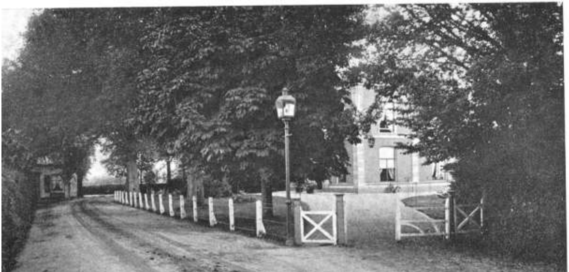
Petroleumlantaarn aan de Klomperweg te Lunteren - foto ca. 1895-1905 (GA16411)

Tot 1863 maakte men in Ede gebruik van olielantaarns. In dat jaar werd de olieverlichting