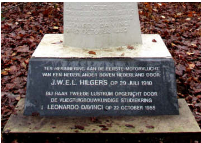
Voet van het Jan Hilgers-monument aan de Zonneoordlaan

Uit krantenberichten blijkt dat heel Nederland in 1910 in de ban was van de vliegsport.